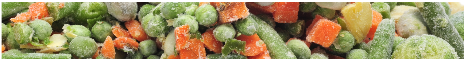
Table Top Fryser